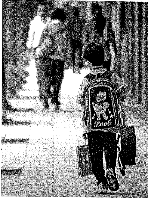
孩子的負擔 ▲背著沉重書包上學，這是升學主義下，學生共同的求學回憶。